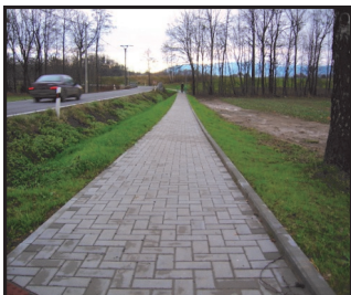
Chodník v Třanovicích (podpořeno v minulém období)

Hlavním cílem opatření je zvýšení bezpečnosti na komunikacích a podpora cyklo dopravy v obcích. Očekáváme, že budou předkládány středně velké projekty do 5 mil. Kč s vysokou potřebností zaměřené na výstavbu, modernizaci nebo rekonstrukci komunikací pro pěší nebo na výstavbu či rekonstrukci komunikací pro cyklisty. Výše podpory může dosáhnout až 95 % celkových způsobilých výdajů projektu. Budou preferovány projekty s kratší dobou realizace.