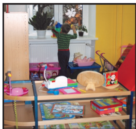
Mateřská školka v Pstruží (podpořeno v minulém období)

Opatření se zaměřuje na zvýšení flexibility školských zařízení a dostupnosti kvalitní vzdělávací infrastruktury reagující na potřeby venkovských společenství zejména v oblastech inkluze, klíčových kompetencí. Výše podpory může činit až 95 % celkových způsobilých výdajů projektu. Mělo by se jednat zejména středně velké projekty obcí, školských zařízení a neziskových organizací vycházející s potřeb identifikovaných v místních akčních plánech rozvoje vzdělávání (MAP). Očekáváme, že na tyto investiční projekty budou navazovat neinvestiční vzdělávací projekty (programy). Výrazně budou preferovány projekty s kratší dobou realizace.