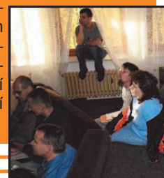
Konference rodin (podpořeno v LEADER+)

Problémem, který projekt řeší je nízká uplatnitelnost na místním trhu práce vybraných skupin nezaměstnaných zejména absolventů, osob po skončení rodičovské dovolené a osob v předdůchodovém věku. V rámci projektu bude účastníkům nabídnuta komplexní služba zahrnující bilanční a pracovní diagnostiku, získání pracovních zkušeností a praxe, poradenství a konzultace, umístění na konkrétní pracovní místo nebo zahájení vlastní výdělečné činnosti.