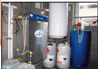
Dojírna společnosti TOZOS (podpořeno v minulém období)

Cílem opatření je rozvoj podmínek pro zvyšování přidané hodnoty a konkurenceschopnosti zemědělství. Maximální výše podpory až do 40 % resp. 60 % celkových způsobilých výdajů projektu bude upřesněna pravidly (dle typu žadatele a projektu). Očekáváme, že budou předkládány malé až středně velké projekty zemědělských subjektů (50 tis. až 5 mil. Kč) řešící zejména následující problémy: zastaralost budov, zařízení a vybavení, vysoké výrobní náklady, nízká účinnost využívání výrobních faktorů a omezený potenciál změny výrobních programů. Výrazně budou preferovány projekty tvořící pracovní místa (s udržitelností 5 let od ukončení realizace projektu). Nebudou podporovány projekty z oblastí chovu včel a rybolovu, nebude podporováno pořízení kotlů na biomasu.