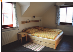
Ubytování na farmě Měňšík (podpořeno v minulém období)

Předpokládané vyhlášení výzvy: červenec 2016 Předpokládaná alokace na první výzvu: 2,5 mil. Kč